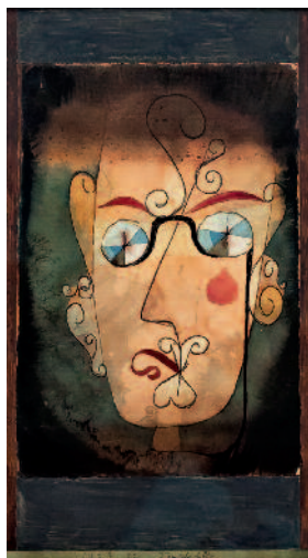
PAUL KLEE Komische Alte