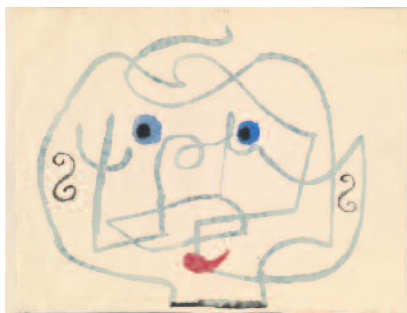
PAUL KLEE Leontine

Feder, Bleistift und Aquarell auf Papier auf Karton 1923, 92 32,5 x 18 cm Dale Taylor & Angela Lustig