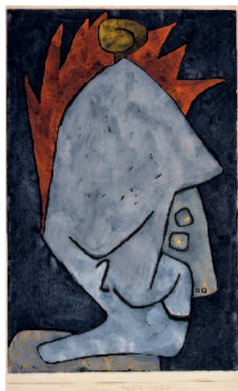
PAUL KLEE Mephisto als Pallas

Aquarell auf Papier auf Karton 1933, 56 48,5 x 62,2 cm Privatbesitz Schweiz, Depositum im Zentrum Paul Klee, Bern