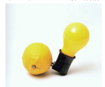
Capri Batterie 1985

Für weitere Informationen kontaktieren Sie bitte Barbara Zmeck +49 89 29 000 863 / b.zmeck@galerie-thomas.de