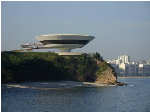
Museu de Arte Contemporânea de Niterói, Brasilien

Galerie Thomas Modern ist stolz, im Museu de Arte Contemporânea de Niterói in Rio de Janeiro, Brasilien, eine umfassende Ausstellung von Joseph Beuys zu präsentieren. Sie enthält mehr als 100 Werke aus allen seinen Schaffensperioden. Bis heute kann sich niemand der außerordentlichen Anziehungskraft der umfangreichen Sammlung des im Jahr 1986 verstorbenen deutschen Künstlers entziehen.