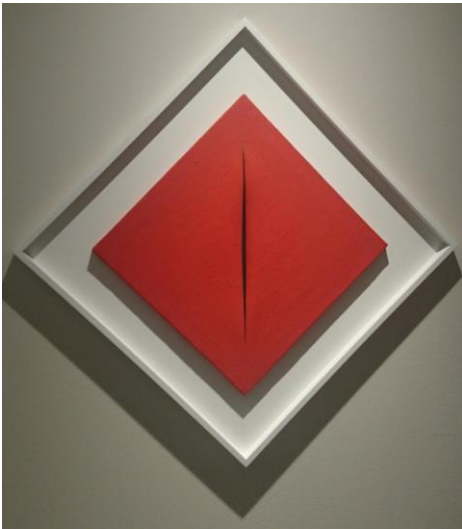
Lucio Fontana Concetto Spaziali, Attesa (1964)

Die sogenannten „Figurenbilder“, die der Beuys-Schüler Imi Knoebel ab 1985 geschaffen hat, thematisieren die Urfrage der Kunst: Was ist ein Bild? Und ab wann ist ein Bild ein Bild? Knoebel nähert sich diesem Problem auch ganz physisch durch die mechanische Verschachtelung einzelner Bildflächen, durch die Befreiung des Bildes, der Malerei von räumlichen Grenzen. Zudem versteht Knoebel das Gemälde nicht mehr als bemalte Bildfläche, sondern als Objekt, das zum Raumobjekt werden kann, und zwar durch einen virtuellen Raum erweitert, der in der Vorstellungswelt des Betrachters liegt.