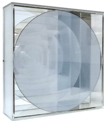
Sphärisches Hohlspiegelobjekt, 1972 40 x 40 x 10,5 cm