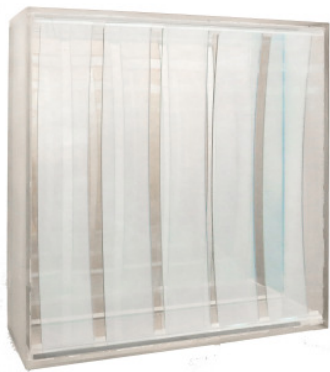
Sphärisches Hohlspiegelobjekt, 1971 25,5 x 25,5 x 7 cm

Die Galerie Thomas Modern zeigt in ihrer Ausstellung neben zahlreichen Licht- und Spiegelobjekten auch einen der frühesten, damals bahnbrechenden Laser-Räume Luthers.