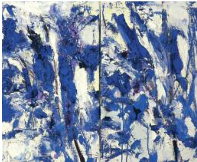
JOAN MITCHELL Ohne Titel