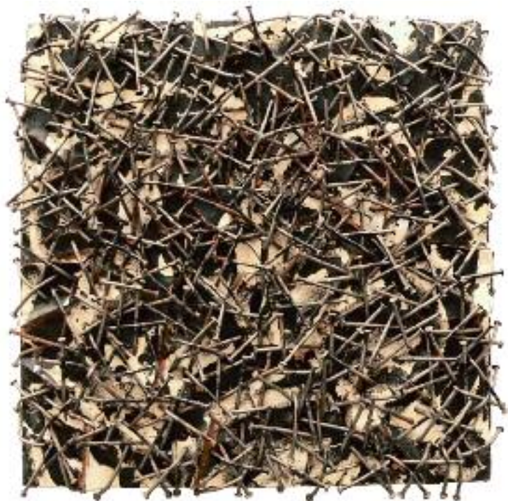
GÜNTHER UECKER Verletztes Feld – Poesie der Destruktion