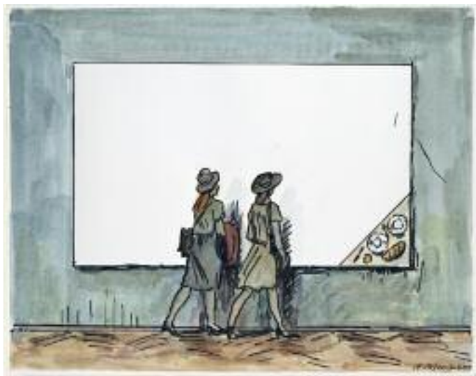
ILYA KABAKOV Breakfast