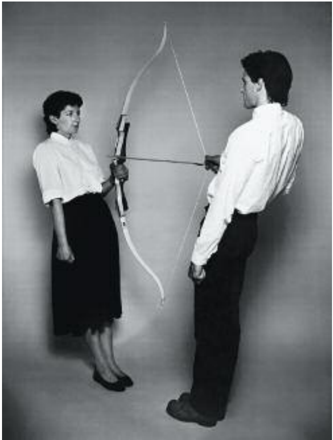
MARINA ABRAMOVIC Rest Energy with Ulay