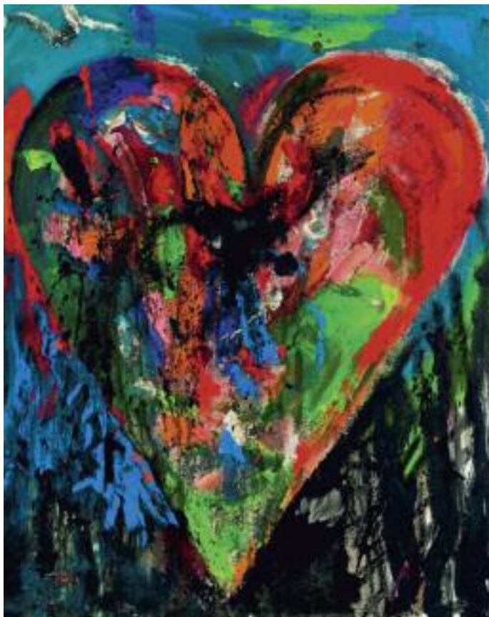
JIM DINE Boo-Boo Blues