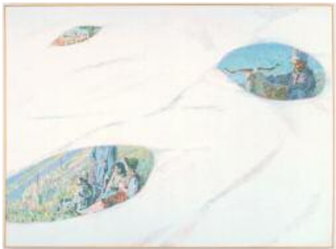
ILYA & EMILIA KABAKOV The Thaw # 1