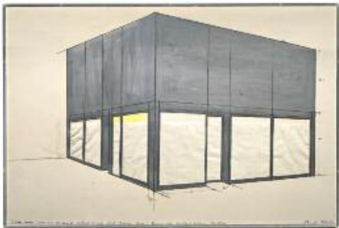
CHRISTO & JEANNE-CLAUDE 3 Store Front