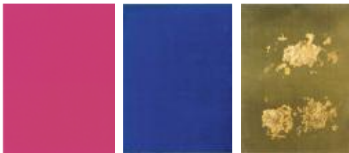
YVES KLEIN Monochrome und Feuer (Tryptichon)