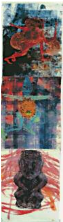
NANCY SPERO À la Recherche