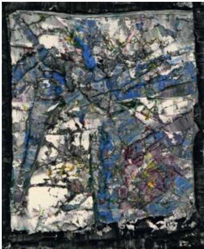
JEAN-PAUL RIOPELLE Ohne Titel