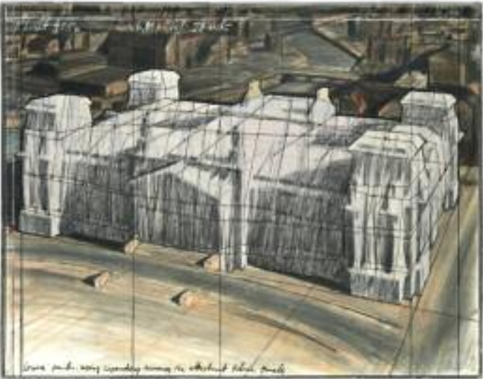
CHRISTO & JEANNE-CLAUDE