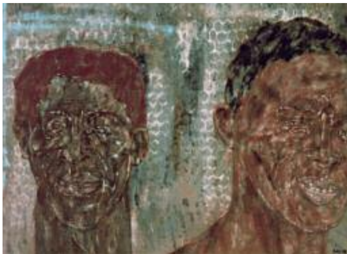
LEON GOLUB Two Heads II