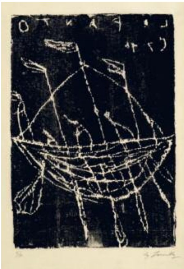
CY TWOMBLY Lepanto I