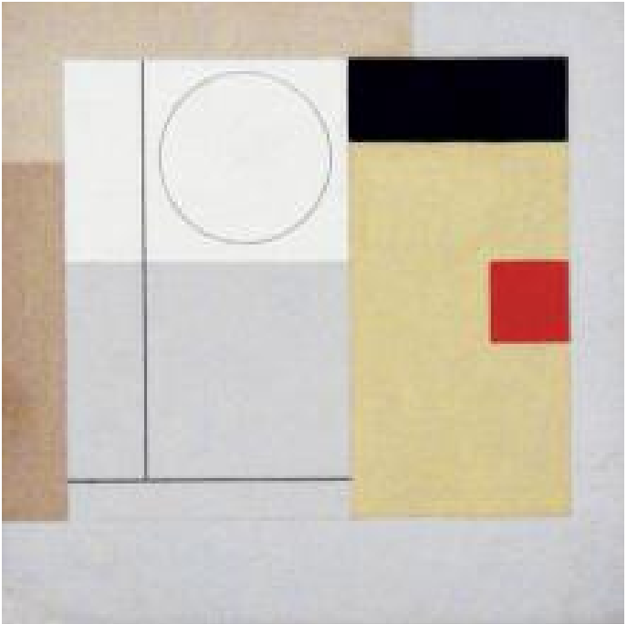
BEN NICHOLSON Painting 1943 (Version VI midget)