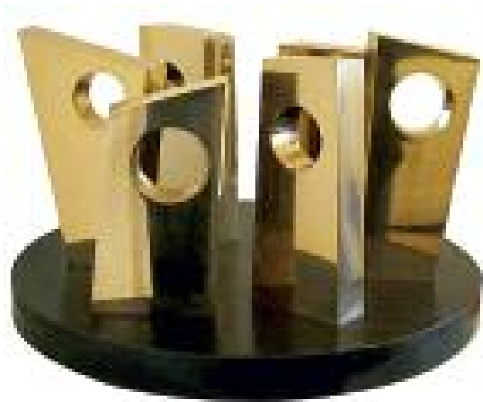
BARBARA HEPWORTH Six Forms on a Circle