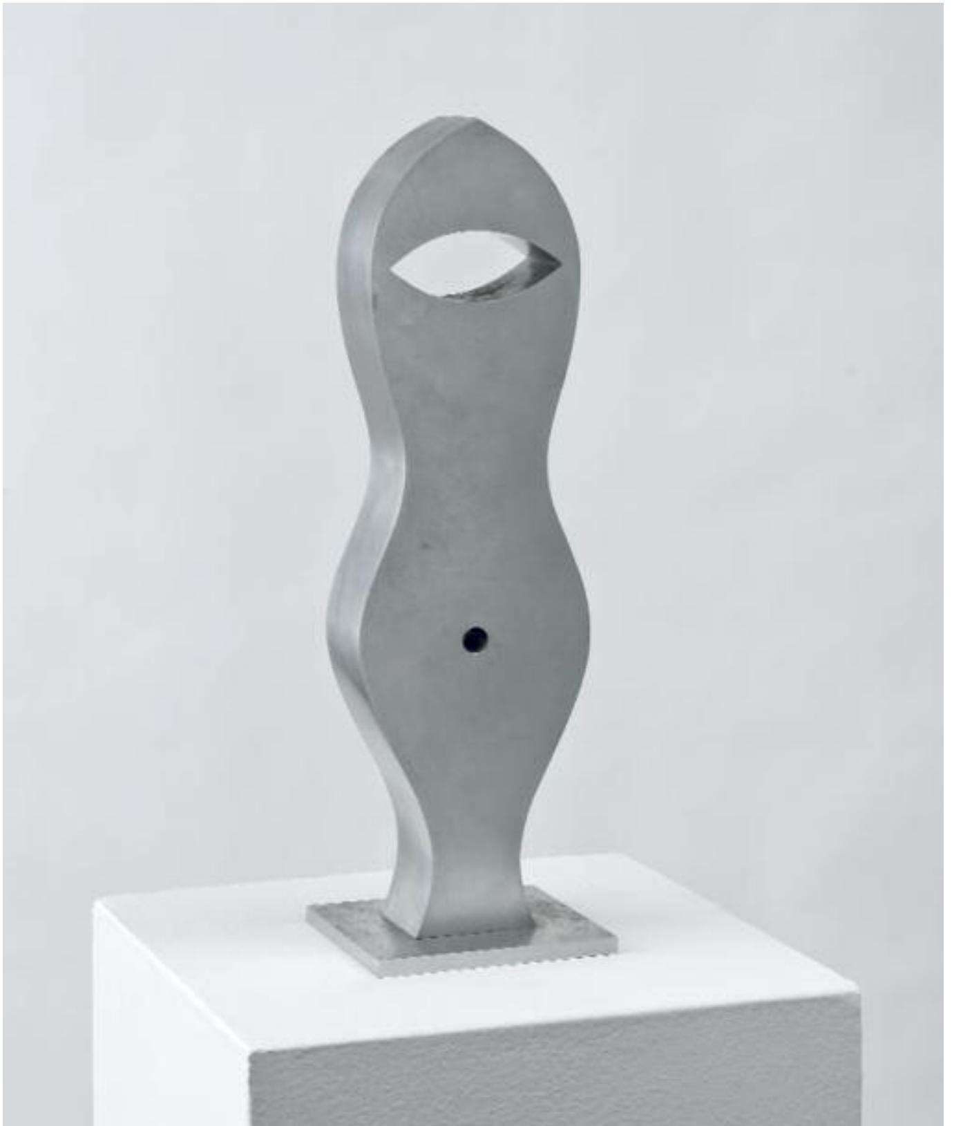
Einaugkrieger Duraluminium One-eyed Warrior