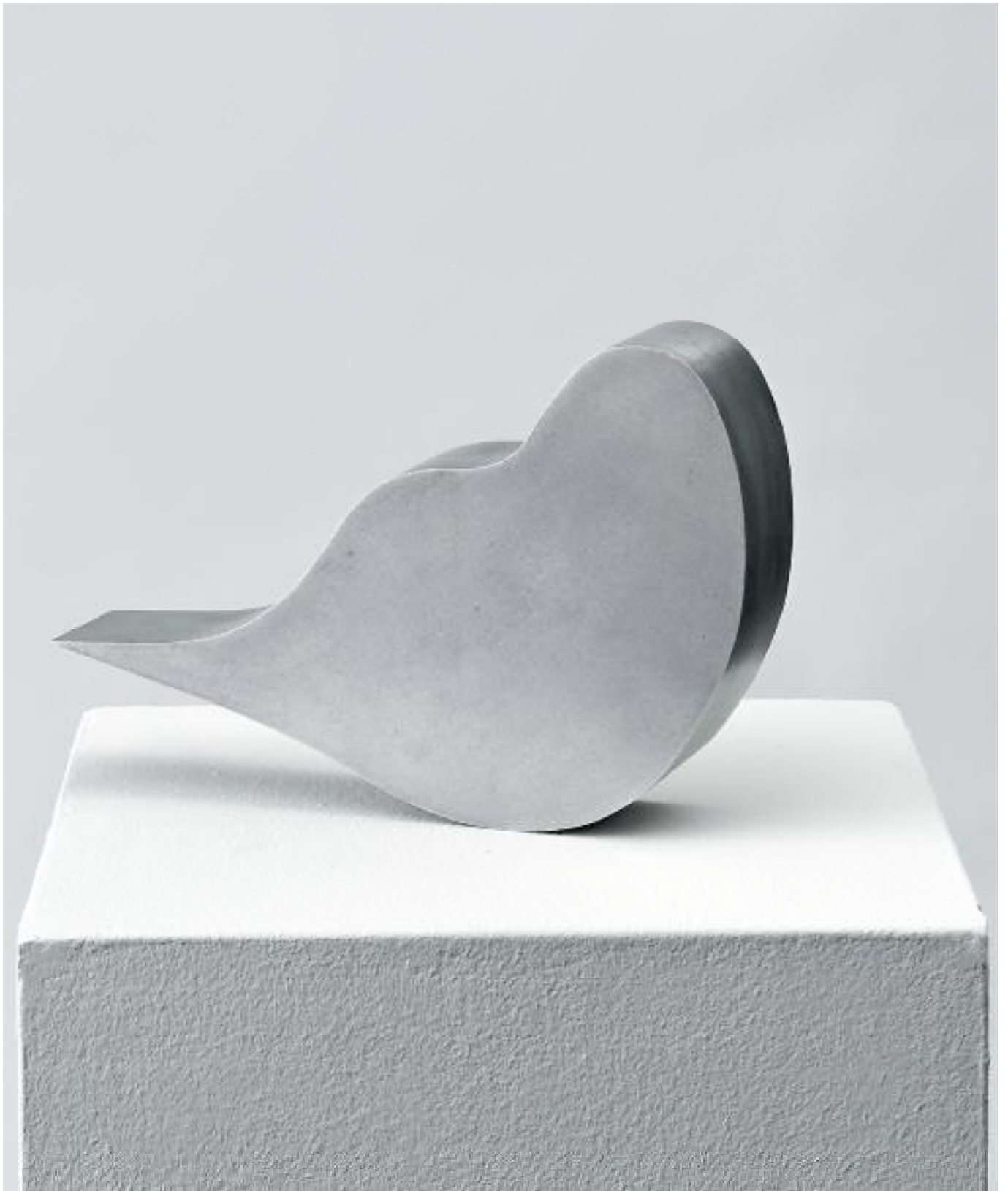
Sehnsucht nach der vierten Dimension Duraluminium Longing for the Fourth Dimension