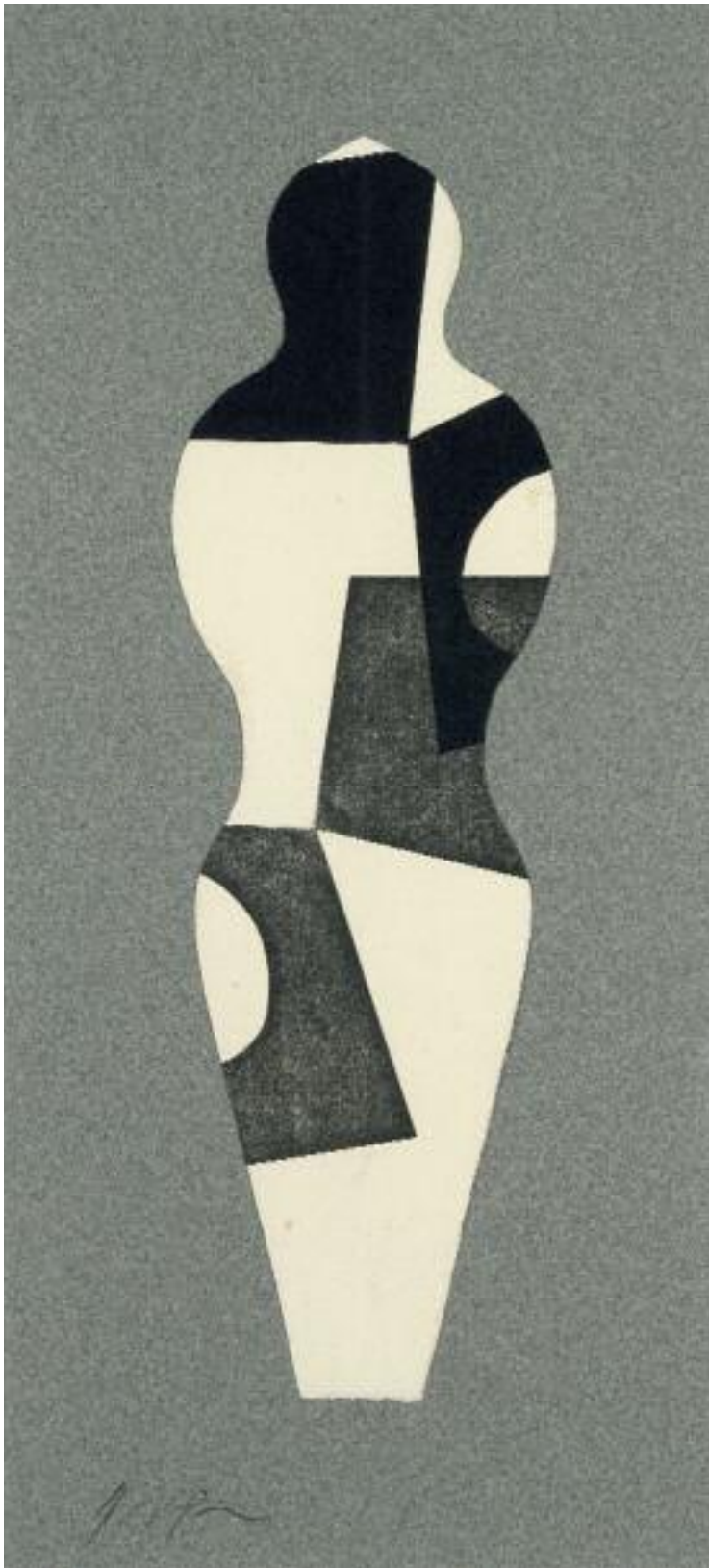
Géométrie humaine II Collage