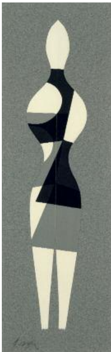
Géométrie humaine bigambe