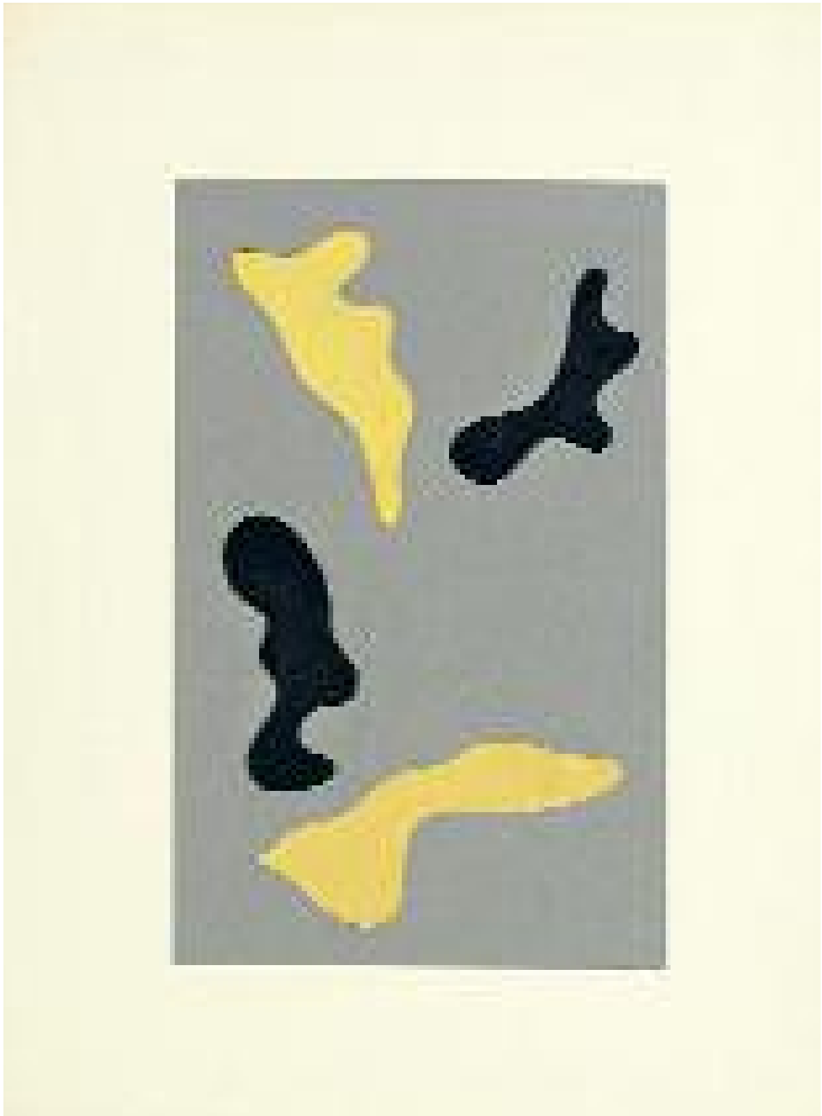
Sans titre Collage Untitled