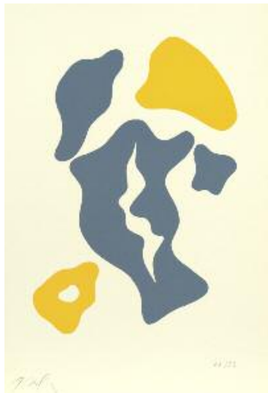
Cueillette Holzschnitt / woodcut