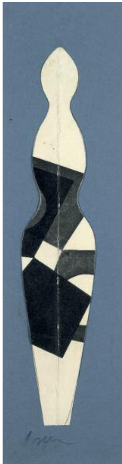
Géométrie humaine à brisure Collage