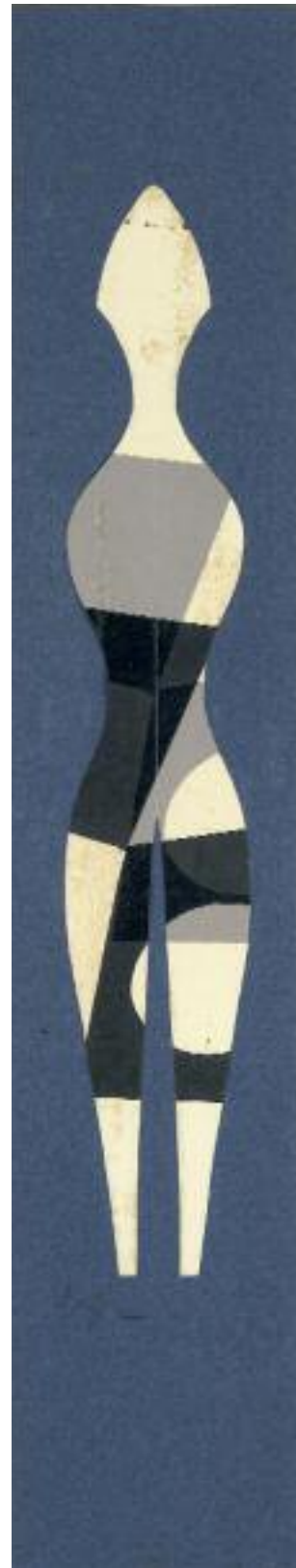
Géométrie humaine bigambe II Collage