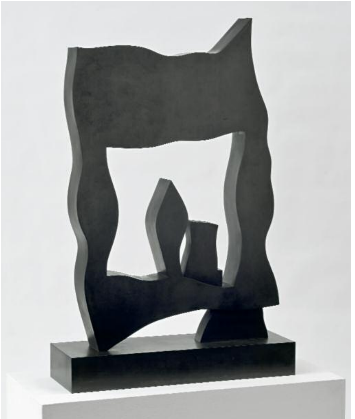
Das kleine Theater Bronze The Small Theatre