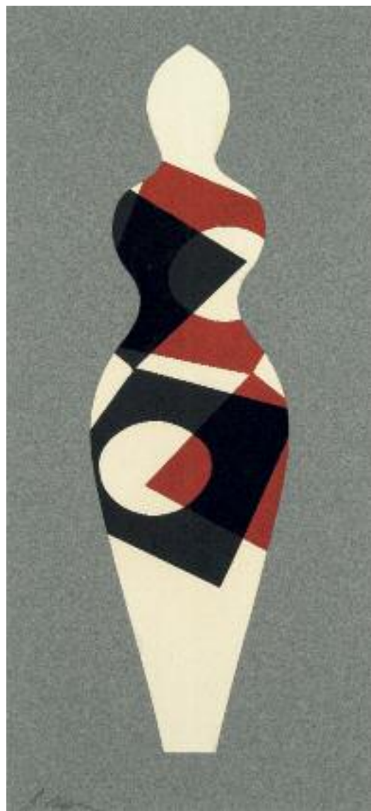
Géométrie humaine III