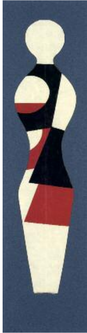
Géométrie humaine IV Collage