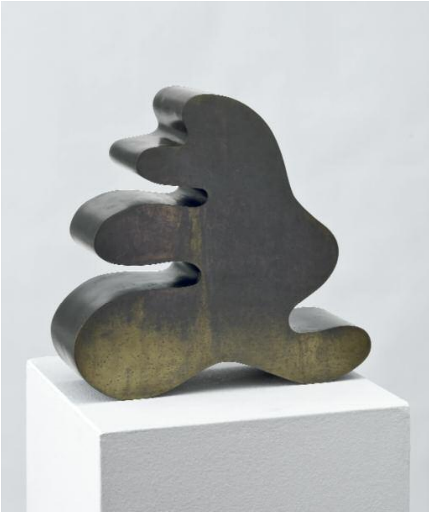
Schwellengestaltung Bronze Threshold Configuration