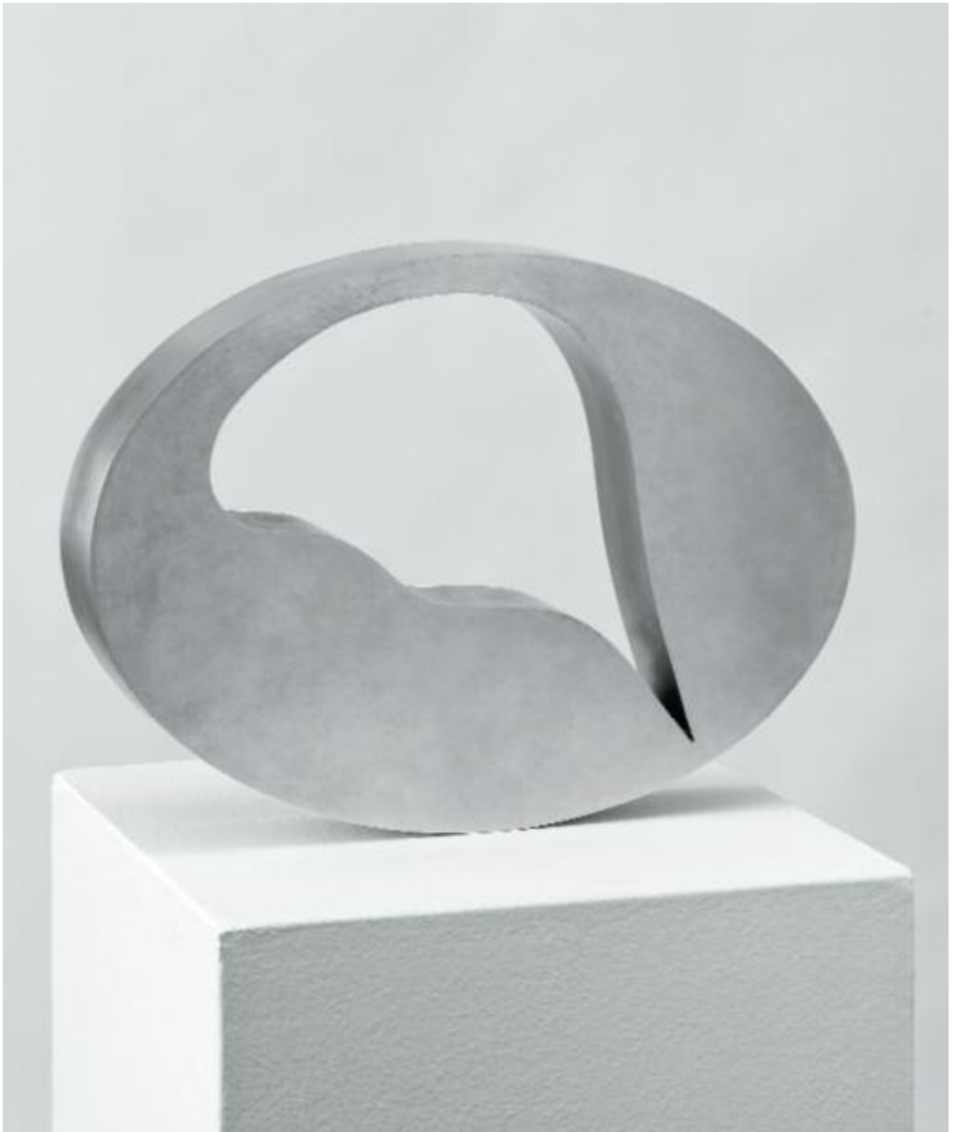
Oriflammenrad Duraluminium Oriflamme Wheel