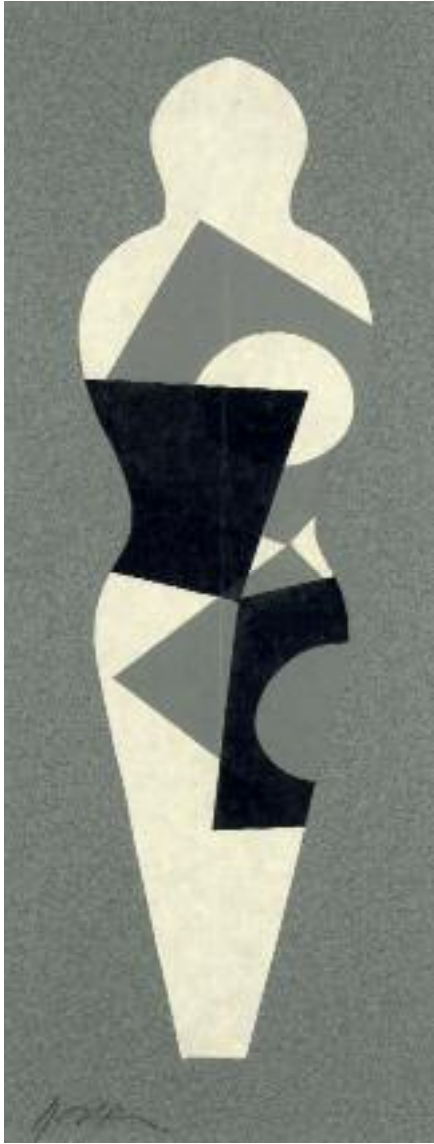
Géométrie humaine I Collage