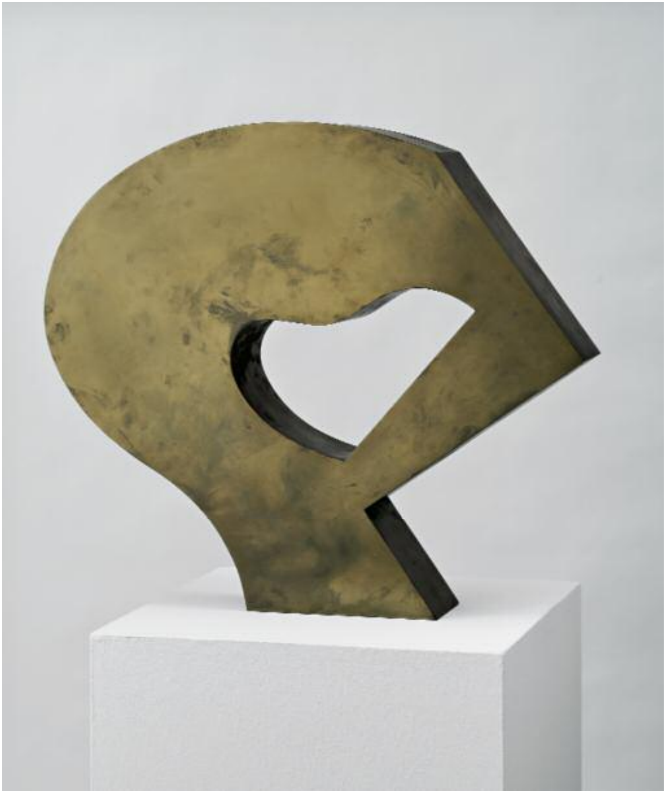
Kopfinitiale Bronze Head Initial