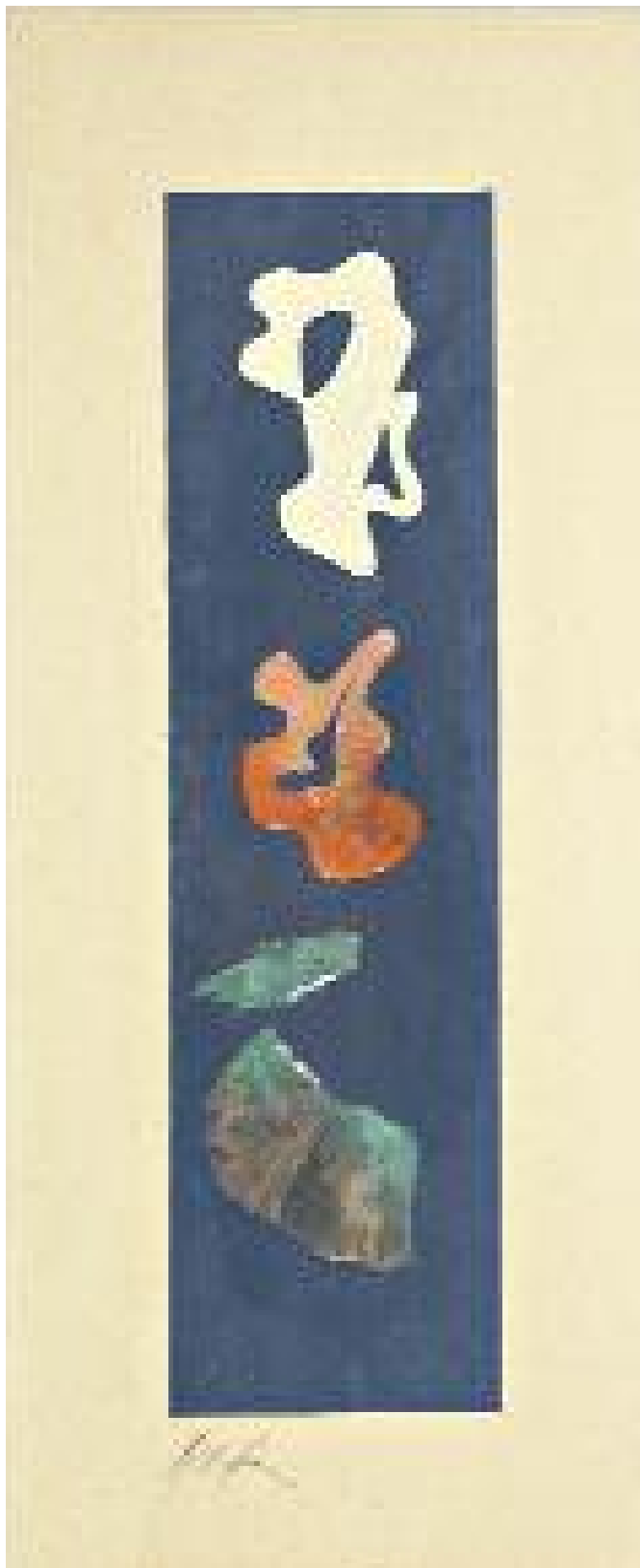
Les cruches Collage, Gouache