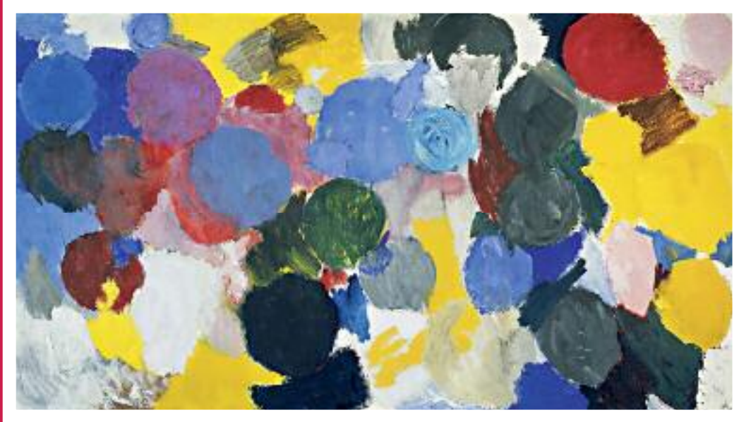
Chromatische Scheiben, 1960