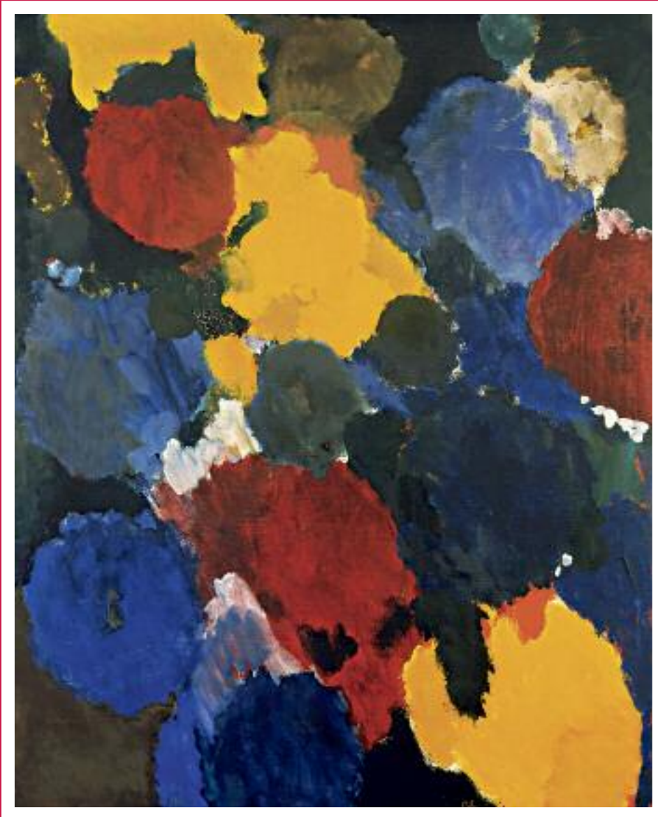
Gelb und Purpur, 1959