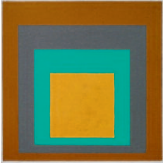
JOSEF ALBERS Homage to the Square Oil on masonite, 1957 24 x 24 in. (61 x 61 cm)