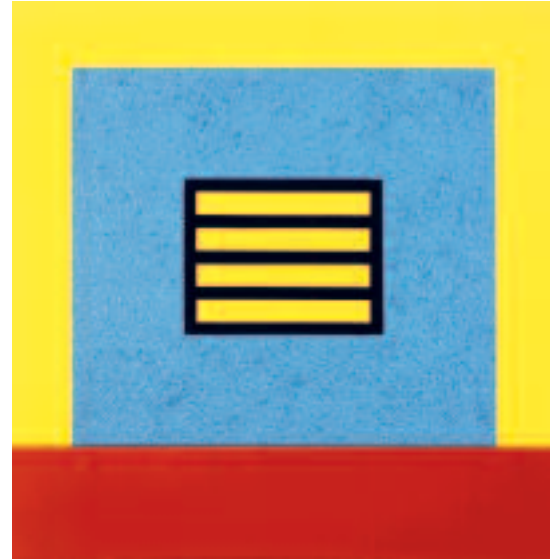
PETER HALLEY Blue Prison Mixed media on canvas, 2007 30 x 30 in. (76,2 x 76,2 cm)