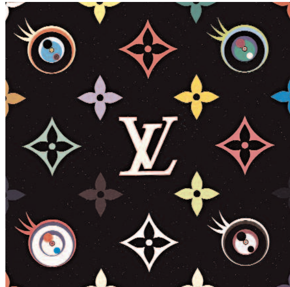
TAKASHI MURAKAMI Eye Love Superflat , 2005, 2 tlg.