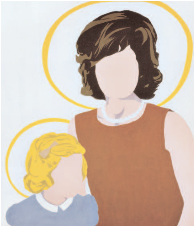
ALLAN D'ARCANGELO Madonna and Child , 1963

Kaum etwas anderes hat Kunst und Gesellschaft so verändert wie die Pop Art. Neugier und Langeweile, die Urkräfte des Pop entwickelten sich zu einer 'High and Low Culture', ohne sich um ein Ziel zu kümmern: Provokation als Mission. Die Hinwendung zum Plakativen und Banalen wurde Programm. Wer sich in Warhols Factory zu exzentrischen Lebensentwürfen traf, bildete den Staat für die heutige Glamourwelt. Marken, Symbole und Ikonen waren Inspirationsquelle für Künstler wie Andy Warhol, Roy Lichtenstein, Tom Wesselmann, Robert Indiana, Mel Ramos, Claes Oldenbourg und Jim Dine.