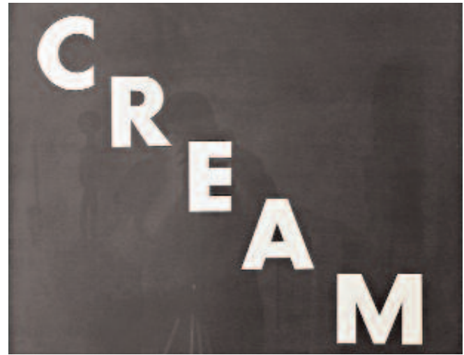
ED RUSCHA Cream , 1974