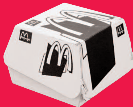
TOM SACHS Big Mac Box , 2007 cover: SYLVIE FLEURY ALAÏA Shoes , 2003

Zur Ausstellung erscheint ein Katalog. The exhibition is accompanied by a catalogue. Bestellung Euro 18,00 plus Versand bei Orders Euro 18,00 plus postage at Eva Beyer: e.beyer@galerie-thomas.de · Fax + 49-89-29 000 877