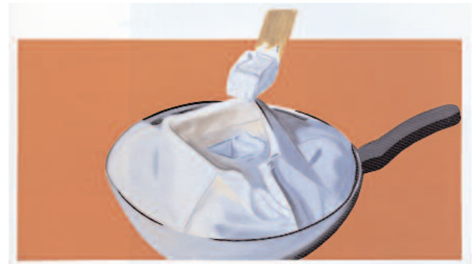
JAMES ROSENQUIST Leaky Neck , 1978