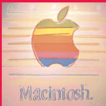
ANDY WARHOL Apple Macintosh , 1986