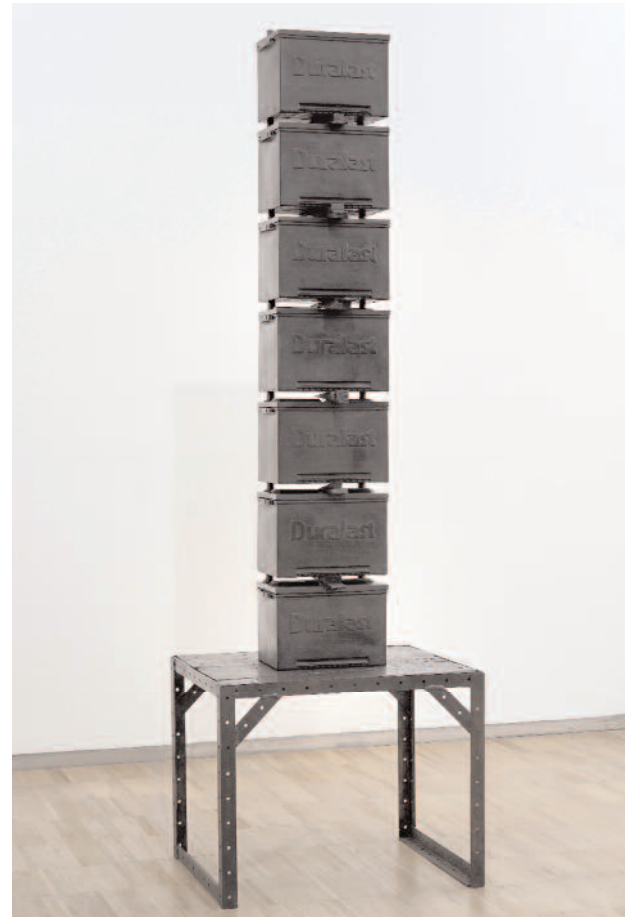
TOM SACHS DURALAST , 2008