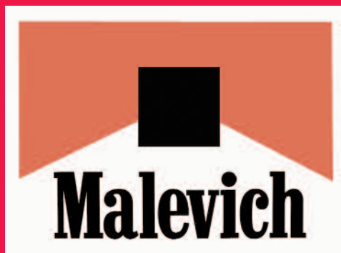
ALEXANDER KOSOLAPOV Malevich Malboro , 2005